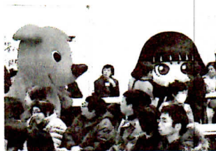
チーバくんを誘って、わちも来たのちゃ〜♪(カムロちゃん)