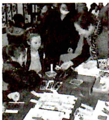
赤い羽根のしおりづくり。これもボランティア!