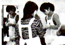
初参加の「メディカルメイク」大勢の人が体験