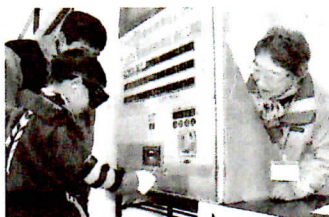
アイマスクと手袋をつけて高齢者疑似体験。切符を買うのも一苦勞