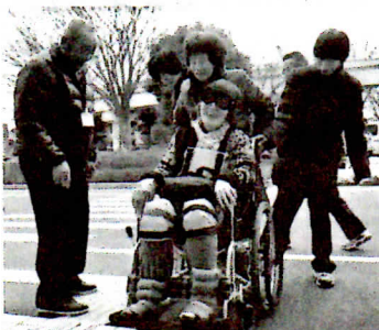
車いすを押すのは意外とむずかしい。段差に苦勞し、車イスの疑似体験者も思わず苦笑い

寒さの中にも春を感じる2月9日、志津コミュニティセンターに於いて佐倉市ボランティア連絡協議会（V連）主催・佐倉市社会福祉協議会共催、第31回ボランティアのつどいが開催され、760名の参加がありました。ブース出展やステージでの活動発表など、会場は活気と熱気に包まれていました。 今年度のV連のスローガンは、「仲間づくり」。つどいのテーマも「仲間づくり」とし、創作寸劇やボランティアをする立場、受ける立場の体験コーナー、簡単にできるボランティアのコーナーが多数設けられました。ボランティアについての理解を深めてもらい、活動の一步を踏み出すきっかけになるような場になりました。 また各コーナーを、志津地区社協、ユウカリが丘地区社協、志津南部地域包括支援センター、(福)愛光、佐倉市ろう者協会、千葉県中途失聴難聴者協会、佐倉市自立支援協議会、順天堂大学、屋外のプログラムでは、寒風をものともせず佐倉西高等学校の有志の皆さんを中心に多くの方々の協力に支えられたつどいでした。