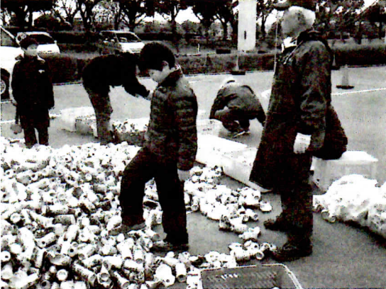
簡単にできるボランティア活動「空き缶つぶし」 エコ活動と施設支援に貢献。この日、約40kgを達成

寒さの中にも春を感じる2月9日、志津コミュニティセンターに於いて佐倉市ボランティア連絡協議会（V連）主催・佐倉市社会福祉協議会共催、第31回ボランティアのつどいが開催され、760名の参加がありました。ブース出展やステージでの活動発表など、会場は活気と熱気に包まれていました。 今年度のV連のスローガンは、「仲間づくり」。つどいのテーマも「仲間づくり」とし、創作寸劇やボランティアをする立場、受ける立場の体験コーナー、簡単にできるボランティアのコーナーが多数設けられました。ボランティアについての理解を深めてもらい、活動の一步を踏み出すきっかけになるような場になりました。 また各コーナーを、志津地区社協、ユウカリが丘地区社協、志津南部地域包括支援センター、(福)愛光、佐倉市ろう者協会、千葉県中途失聴難聴者協会、佐倉市自立支援協議会、順天堂大学、屋外のプログラムでは、寒風をものともせず佐倉西高等学校の有志の皆さんを中心に多くの方々の協力に支えられたつどいでした。