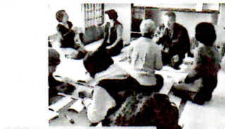
たくさんの方が参加した手話体験コーナー