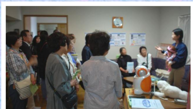
バス研修会 認知症のある方の福祉機器展示館(所沢)