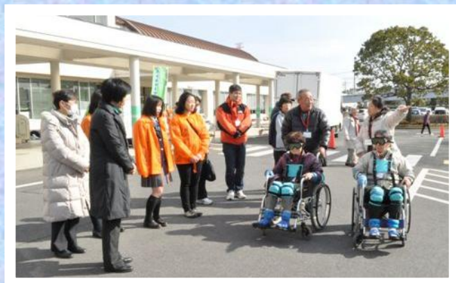
高齢者疑似体験&車イス体験