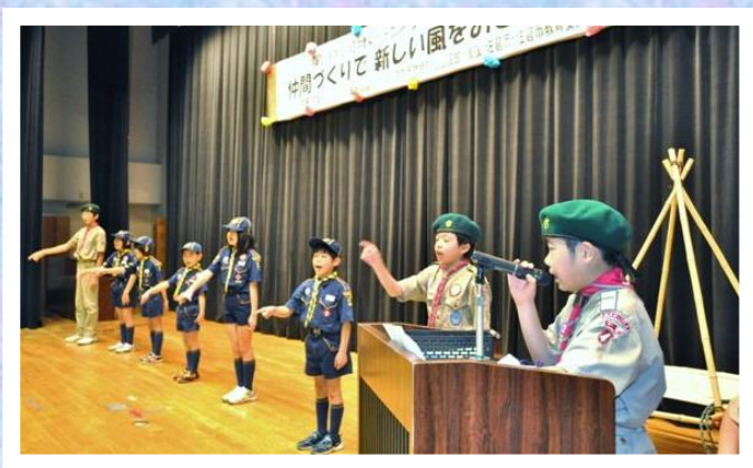
ボーイスカウト佐倉第4団 活動発表