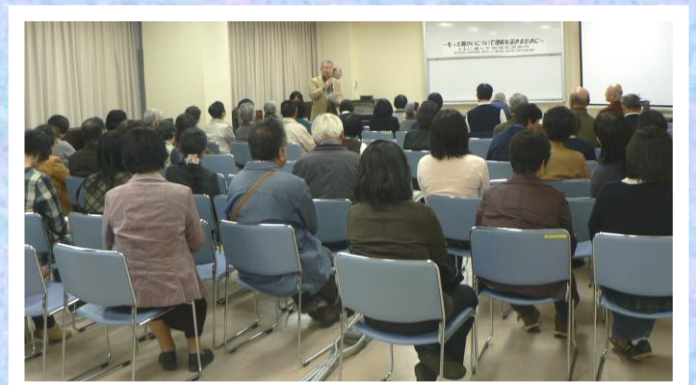
交流会 ともに暮らす地域交流会Ⅳ ～もっと障がいについて理解を深める為に～