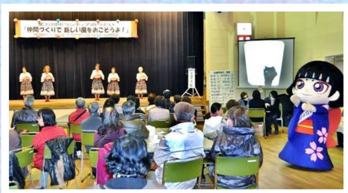
カムロちゃんも会場に！