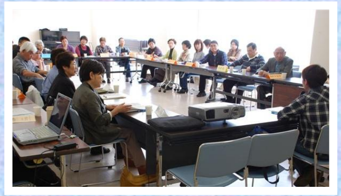
学習会 テーマ:「仲間づくり」 ～みんなで取り組み課題を共有すること～