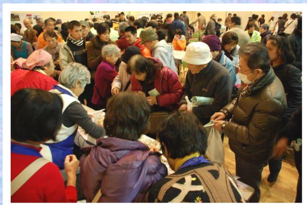
大ホール 屋食コーナー どのお弁当にしようかな？