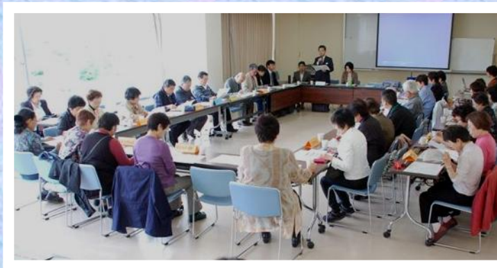
第1回運営委員会(総会)