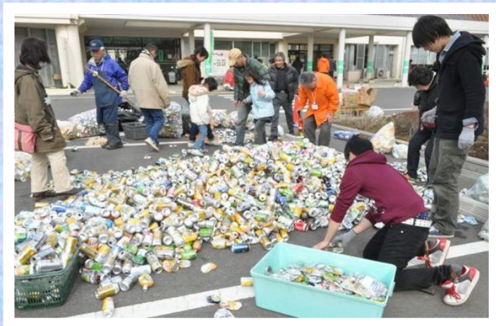
簡単ボランティア体験 アルミ缶つぶし