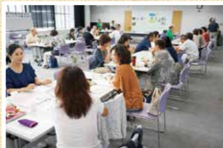
ボランティア活動見本市 9/10(土) 活動を紹介し合い、参加者が席を自由に移動して活動について語り合いました。