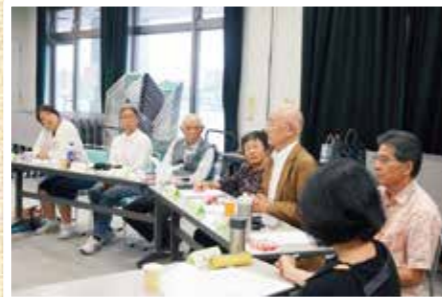
個人ボランティアのつどい10/9(日) 松山毅先生の「ささえあい」のまちづくりとボランティア活動の講話の後、懇談会で意見交換しました。