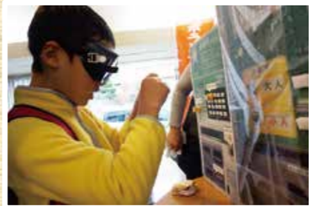
ボランティア・市民活動フェスタ2016in佐倉 11/27(日) 体験(車いす・おとしより・ユニバーサルデザイン)コーナーで、日常生活の困り事や不便さを知る機会としました。