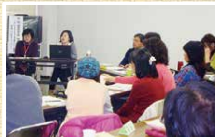
研修会 12/14(水) 熊本地震で災害ボランティアセンターへ派遣された社協職員の方に、災害時の活動や現場での課題など、経験を踏まえたお話を聞きました。