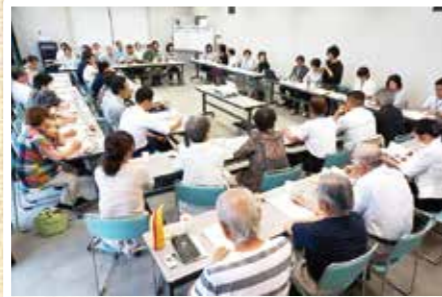
印旛郡市V連協交流会 6/22(水) 「グループ活動の活性化の取組みについて学ぶ」をテーマに、栄町、成田市、富里市、八街市のV連協と、事例発表と意見交換しました。