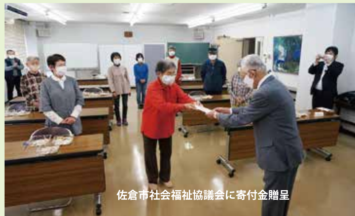
佐倉市社会福祉協議会に寄付金贈呈

※回収箱設置場所: 西部・南部地域福祉センター、志津・白井・ユーカーが丘郵便局、商工会議所、印旛地区合同庁舎、志津コミュニティセンター、社会福祉協議会