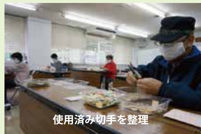
使用済み切手を整理