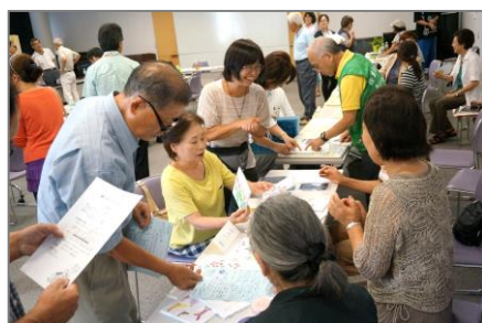
「ブース・フリースペースで語り合おう！」です。