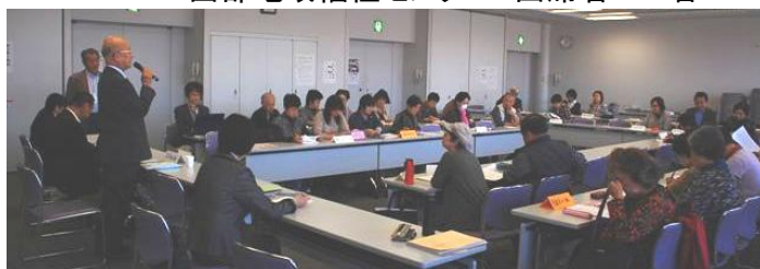
「ボランティアのつどい」を考えるためのアンケート報告 (抜粋)

※「2012年度活動報告」「2013年度活動計画」はV連ホームページで見ることができます。