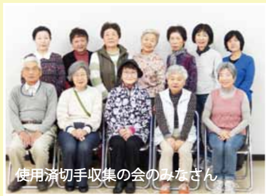
使用済み切手収集の会のみなさん

に設置している使用済み切手ポストに入れて下さった方々、また、施設、企業、個人の方で直接ボランティアセンターへ使用済み切手を届けて下さった方々、いつもご協力ありがとうございます。たくさんの皆さんのご好意が集まり、かたちが変わっていきます。心よりお礼申し上げます。ありがとうございました。