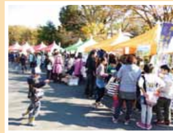
さくらボランティア・市民活動フェスタ2013