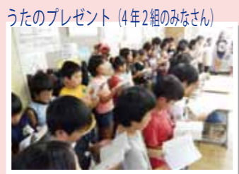
うたのプレゼント (4年2組のみなさん)

子ども達も休み時間には、ボランティアさんの控室に顔をのぞかせ楽しみにしているようでした。