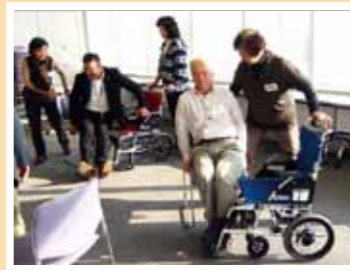
ともに暮らす地域交流会V

たくさんの方々に参加いただき、新たな出会いと気づきがありました。これからもチャレンジしつづけるV連でありたいと思います。