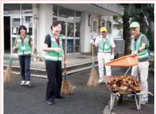
根郷小学校「ふれあいボランティア」のみなさん (水曜午前担当)